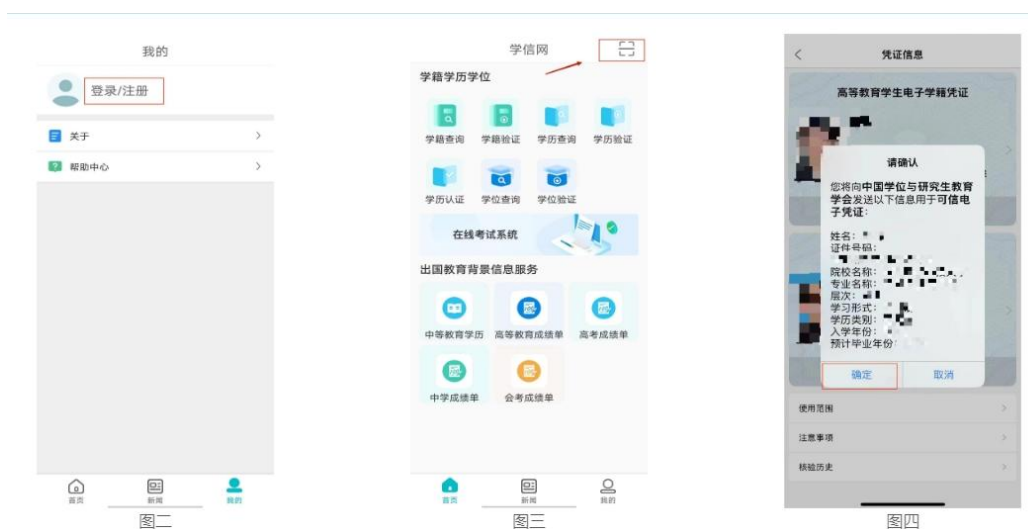
图 学信网验证界面