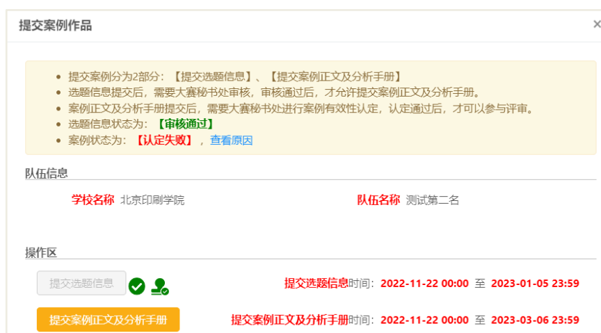
图 提交案例作品界面

在提交案例作品界面，点击【提交选题信息】，填写案例题目和摘要。提交完成后，将由组委会秘书处对选题信息进行审核。审核通过视为选题信息提交成功。